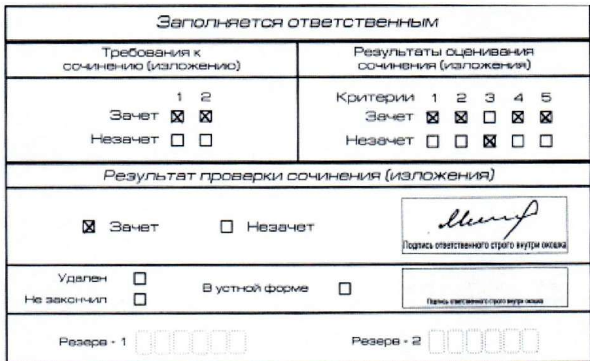
Рис. 11. Область для оценки работы

После окончания заполнения бланка регистрации ответственное лицо ставит свою подпись в специально отведенном для этого поле.