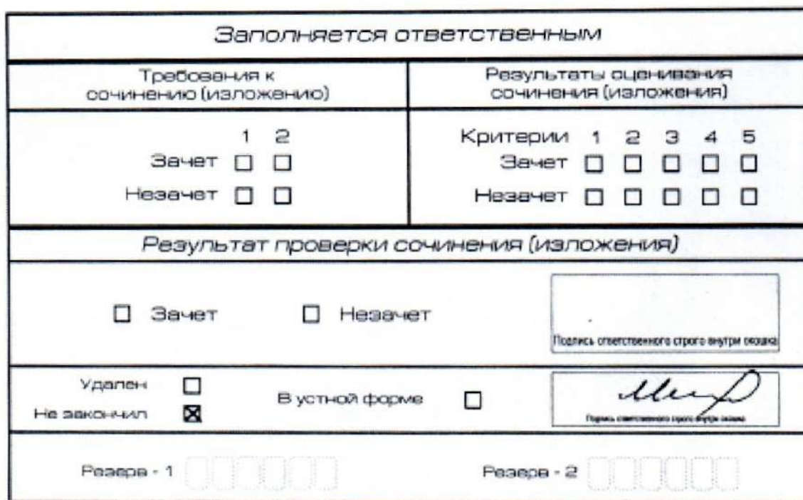
Рис. 6. Заполнение полей нижней части бланка регистрации (завершение написания сочинения (изложения) по уважительным причинам)