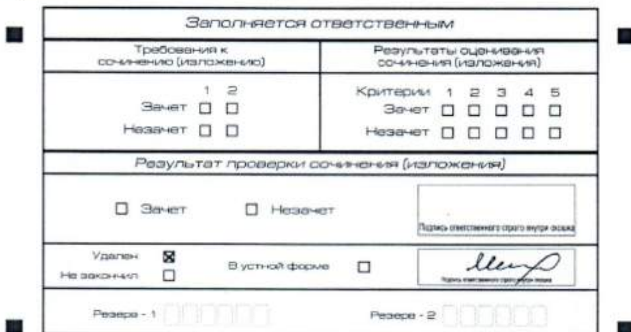
Рис. 7 Заполнение полей нижней части бланка регистрации (удаление с экзамена)

В бланке регистрации указанного участника итогового сочинения (изложения) необходимо внести отметку «X» в поле «Удален». Внесение отметки в поле «Удален» подтверждается подписью члена комиссии по проведению итогового сочинения (изложения).