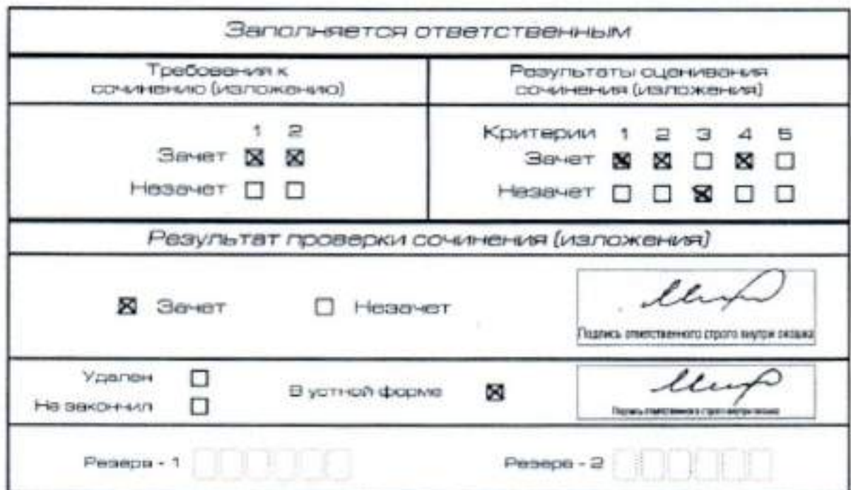
Рис. 12. Область для оценки работы сочинения (изложения) в устной форме

После окончания заполнения бланка регистрации ответственное лицо ставит свою подпись в специально отведенном для этого поле.