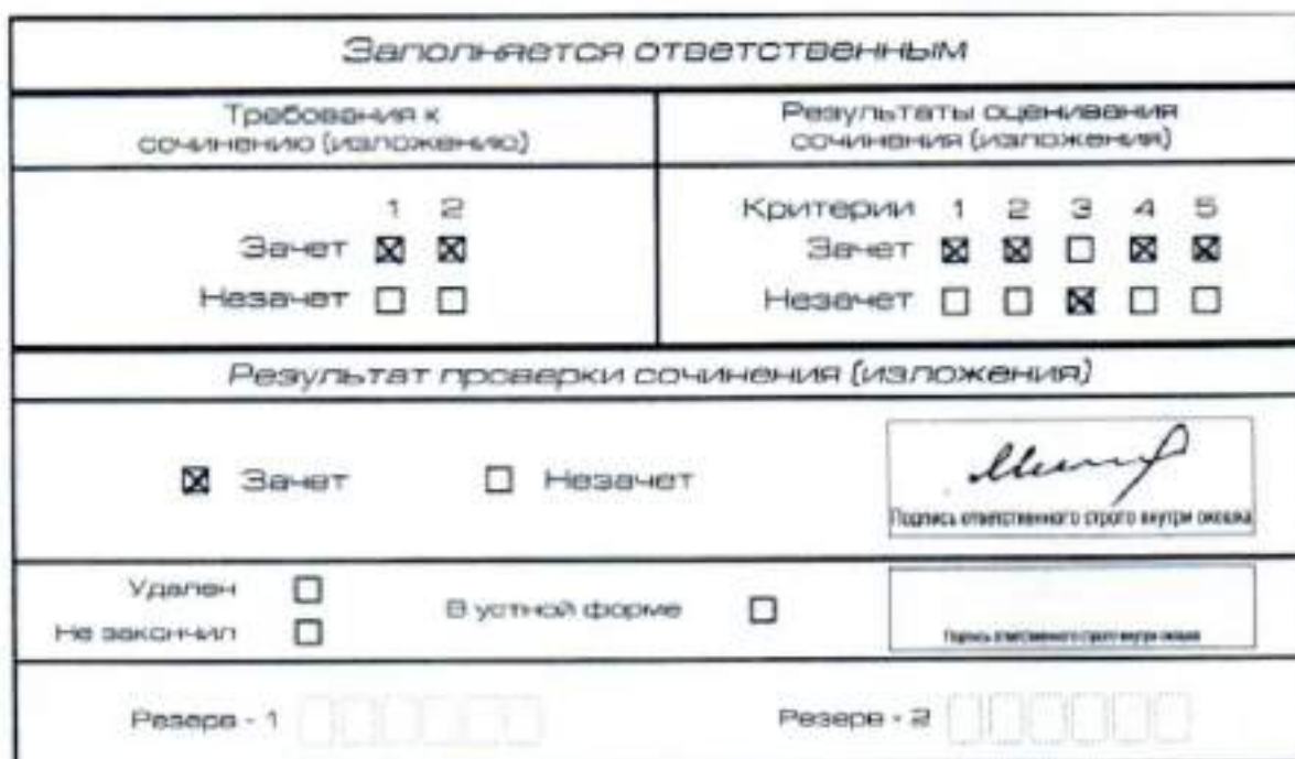
Рис. 11. Область для оценки работы

После окончания заполнения бланка регистрации ответственное лицо ставит свою подпись в специально отведенном для этого поле.